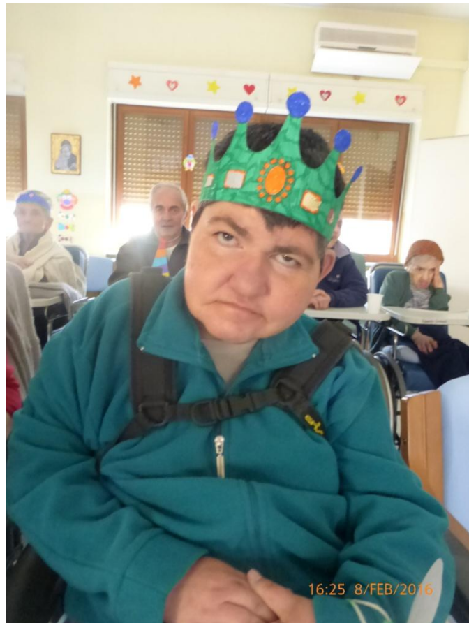
Le nostre principesse...